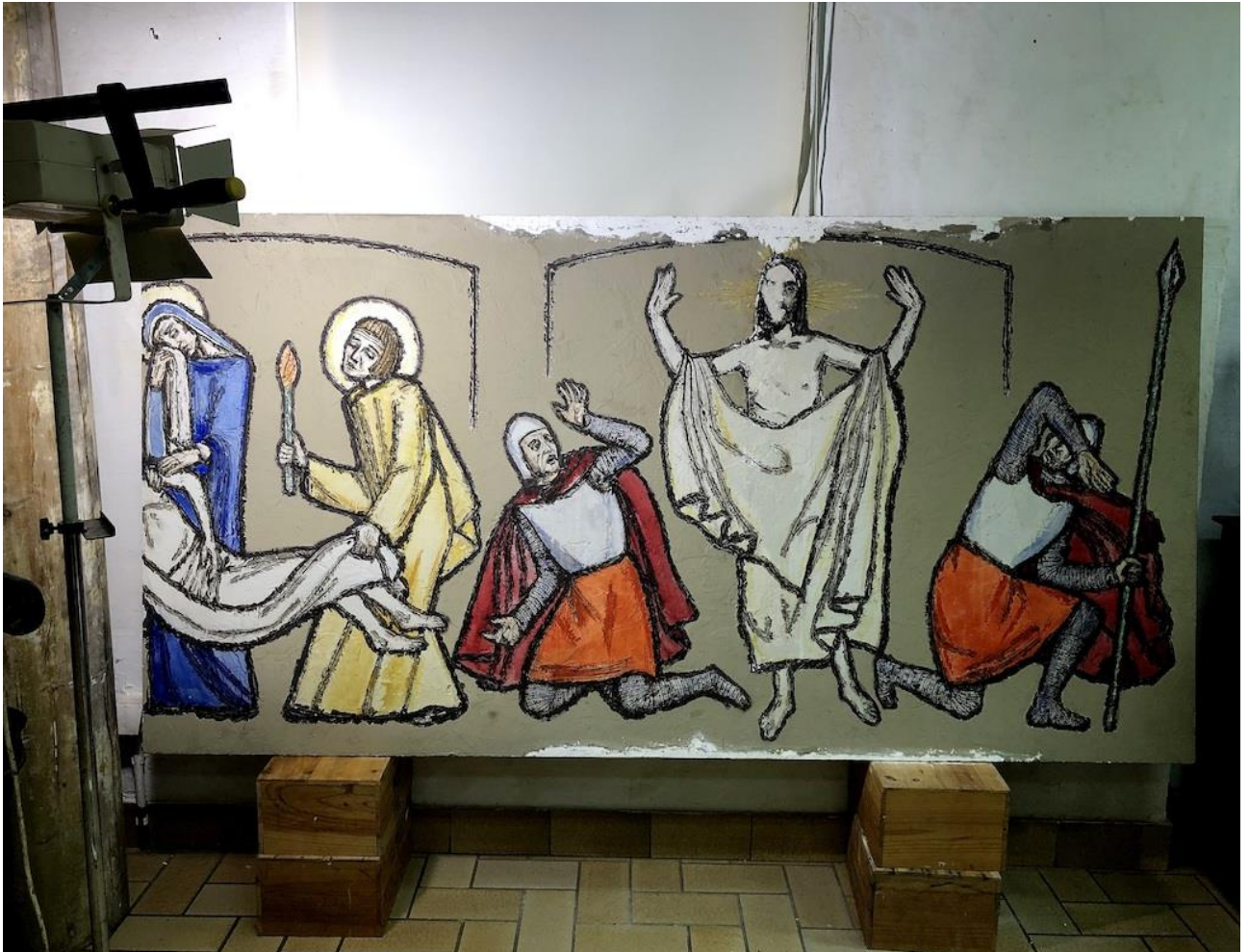
Foto tijdens de restauratie van het beschadigd schilderij.

Het schilderij werd zwaar beschadigd door waterinsijpelingen na een lek in het plafond.