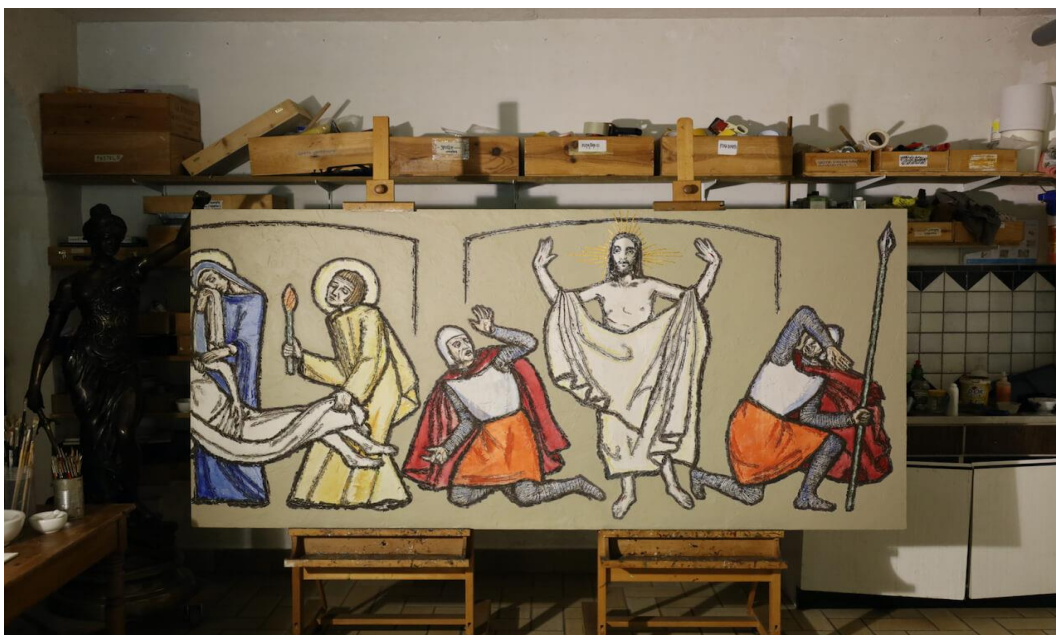
Het schilderij in herstelling in het atelier KERAT